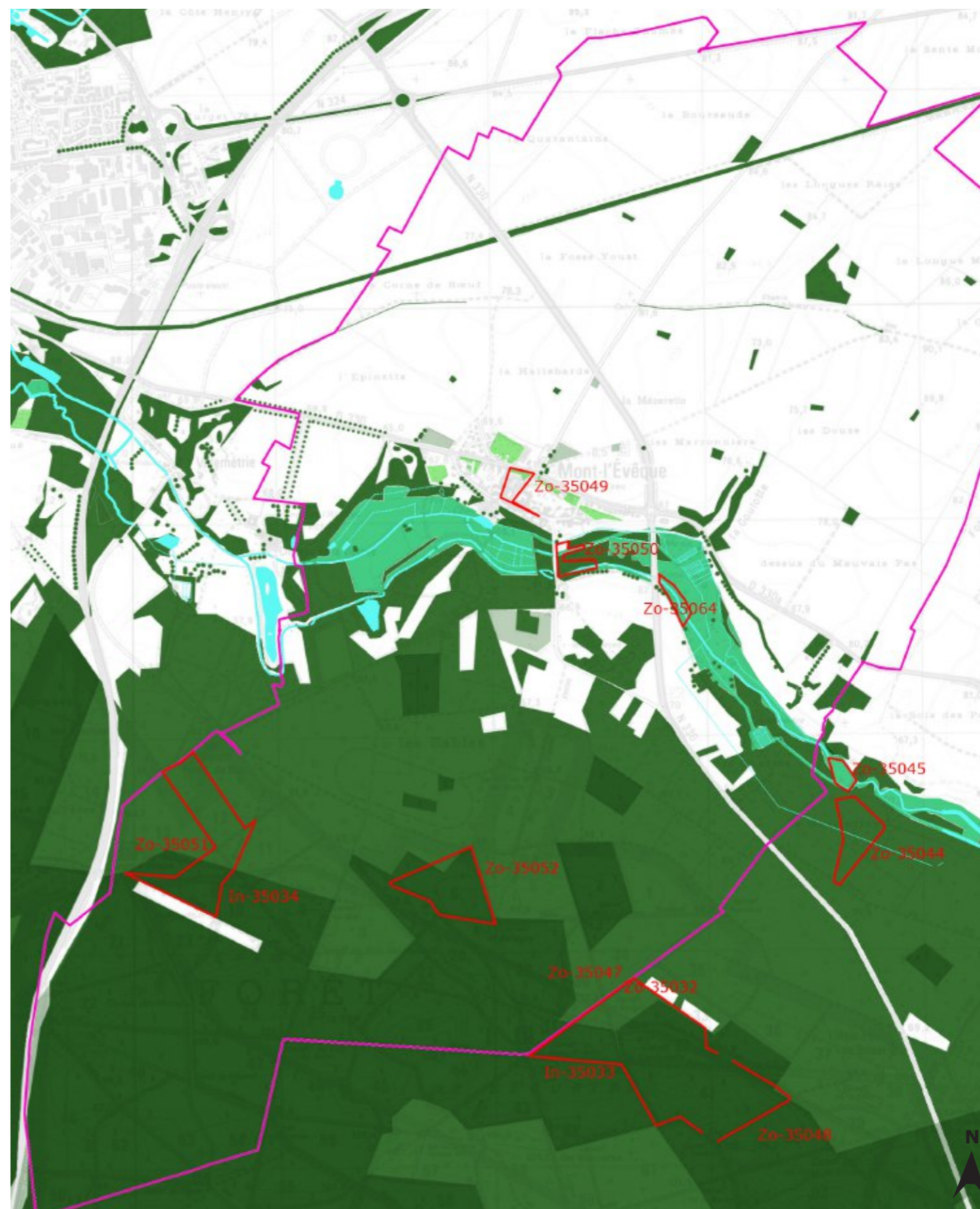
Carte de l'inventaire floristique

Les contraintes particulières provoquées par la proximité de la région parisienne pourraient trouver des réponses adaptées dans le projet de Parc Naturel Régional.